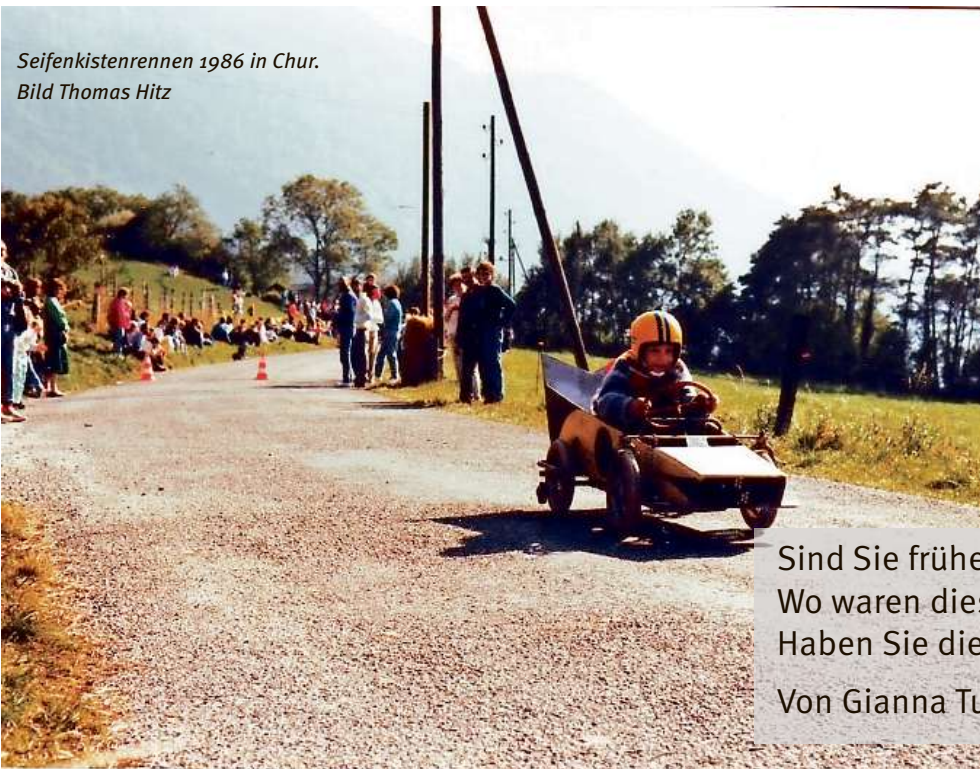
Seifenkistenrennen 1986 in Chur.